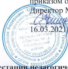
График проведения аттестации педагогических работников МБОУ ДО СЮТ г. Туапсе